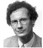
Prof. Walter Stoffel Faculté de Droit Droit international et droit commercial

“ En 1997, nous proposons des quiz accessibles uniquement depuis une salle PC de l'Université installée à cet effet. Le Centre NTE les a adaptés au web de telle sorte qu'ils sont maintenant accessibles depuis n'importe où. ”