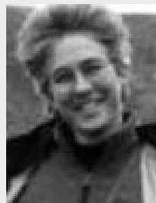
P. McNamara Internet, Flash