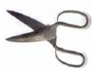
Ciseaux à tondre même usage mais manipulation plus aisée